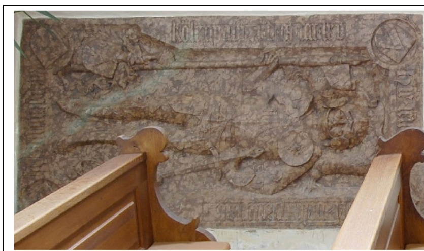
Liegendes Rotmarmor-Grabmal des Pangraz Hochholdinger d. Ä., im Eingangsbereich der Pfarrkirche von Pilsting.