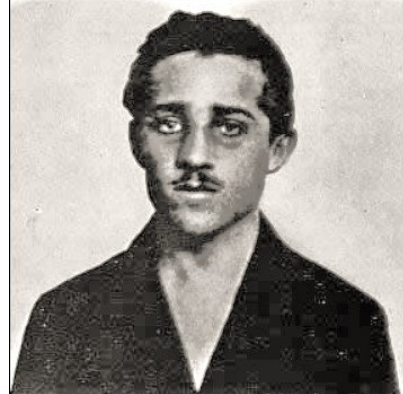
Der Attentäter Gavrilo Prinzip

In einer Zeichnung wird die Ermordung des Österreichischen Thronfolgers Franz Ferdinand und seiner Gattin Erzherzogin Sophia von Hohenberg porträtiert.